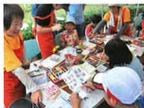
こどもまんようまつり