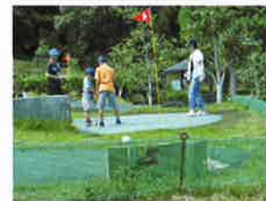
パターで遊んでお土産ゲット