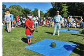
みどりの夏まつり