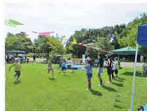
PLAY GROUND FES