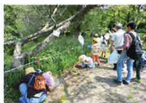
春の虫を探しに行こう