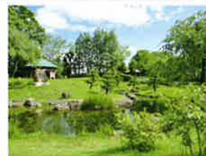
万葉時代の植物を育てよう