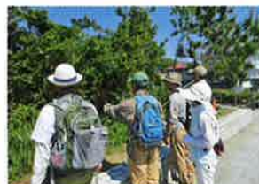
自然観察会（海岸の植物たち）