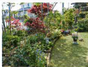
春のはままつ庭めぐり